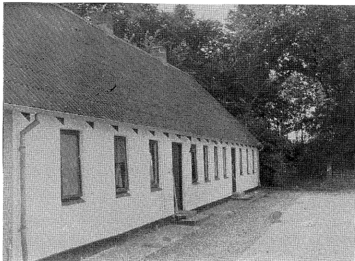
Villerslevgaards stuehus fotograferet fra gårds- pladsen 1985.